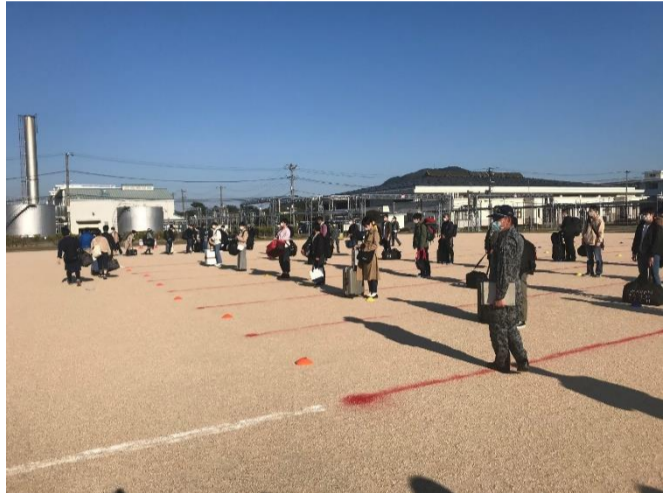
着隊時の様子(空自防府南基地)

保護者や友人としばしの別れを惜しむ光景には、引率支援する地本員も目頭を熱くしました。 今年、新型コロナウイルスの影響を受け、着隊時には健康状態の確認とソーシャルディスタンスにも配慮していません。新入隊員、新入生の間にも同期との絆を深め、この間にも二回りの成長していることと自衛官への扉を開いた彼らに、教育訓練を終え、立派な自衛官となり長崎へ戻って来ることを見送っています。 (募集課)