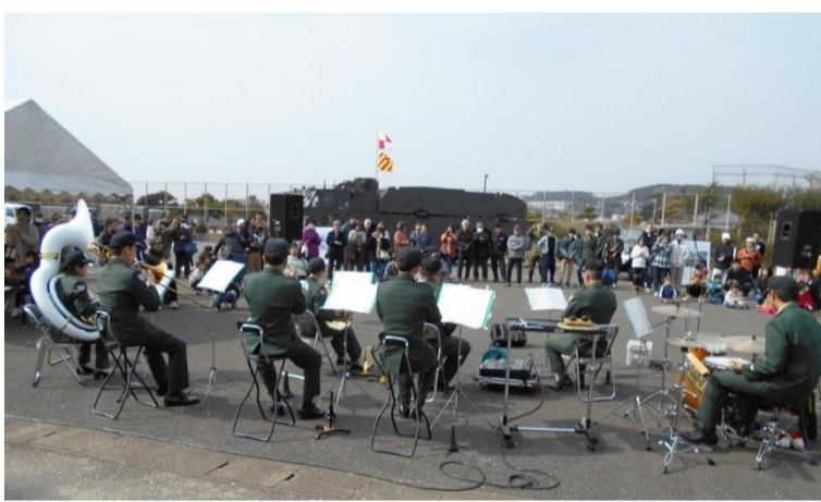
ミニコンサートで演奏を行う 小郡駐屯地音楽部 (五島市三井楽漁港)